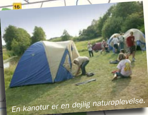
En kanotur er en dejlig naturoplevelse.

Kanoruten strækker sig over 80 km, fra Herning over Holstebro til Vemb ved Nissum Fjord. Familier skal beregne ca. 25 km til en dagssejlad. Storaå udmærker sig ved den flotte natur, hvor du fra kanoen kan opleve et rigt dyreliv i luften, på land og i vandet. Undervejs er også historiske og kulturelle oplevelser. På strækningen mellem Herning og Holstebro er der et terrænfald på 40 meter der gør, at der altid er "god strøm" som hjælp til fremdriften.